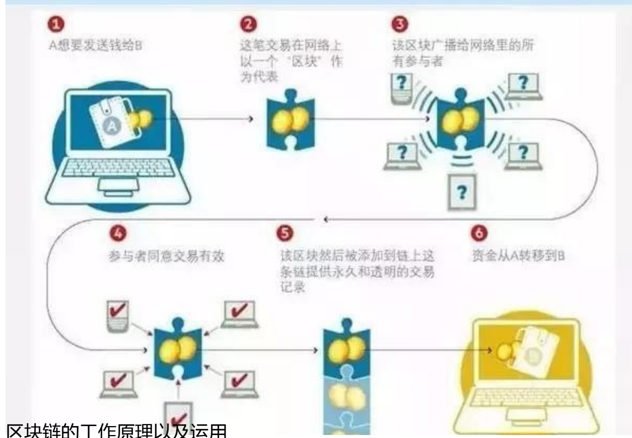
区块链的工作原理以及运用

区块链技术是分布式账本技术中的一种，比特币所采用的就是区块链记账技术，其原理如图